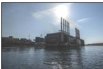
Karpowership Powership „Orhan Bey“, Libanon

Tel. +49 (0) 821 – 322 3126 jan.hoppe@man.eu www.mandieselturbo.com